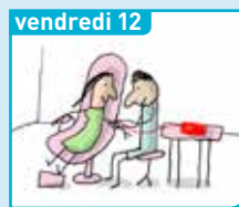
vendredi 12 À quoi ça sert, de donner son sang ?

Pour joindre la rédaction, composer le 05 61 76, puis les 4 chiffres du poste de votre correspondant (entre parenthèses). Directrice éditoriale Planète : M. MAI-VAN-CAN (04 34). Rédactrice en chef : C. LAURANS (04 43). Rédactrice en chef adjointe : E. LUTROUD (04 53). Rédactrice en chef adjointe déléguée au monde dessin : M. REYLLON (04 51). Directrice artistique : N. FAUREL. 1 re rédactrice graphiste : L. BONNET-CALMELS (05 33). Chef de rubrique : C. GAUDET (05 81). Secrétaire de rédaction : E. RENJOT (05 87). Responsable marketing : J.-L. MONCHY. Révision : A. LE BRETON et D. DALEM. Photographe : V. GIRE. Documentation : I. NIFI. SUPPLEMENT NUMERIQUE : Rédactrice en chef : S. BARTHÈRE. Rédacteur en chef technique : C. ASBACHE. Chefs de rubrique : F. BLANQUART, C. TOUATY. 1 er rédactrices graphistes : A. KREBS, C. PÉRIEL. Conseiller pédagogique : M. GRANDNIY. Création maquettes : H. CONVERT.