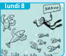
lundi 8 Comment sauvegarder les océans ?

Les autres vidéos de la semaine sur www.1jour1actu.com