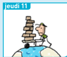
jeudi 11 Pourquoi le travail des enfouis existe-t-il ?