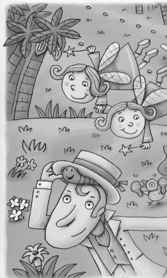
☒ Des voyageurs de l'espace ent

Des voyageurs de l'espace entendent cette invitation. La semaine suivante, une fusée vert pomme se pose sur la planète Z-99. Et qui en descend ? Les meilleurs amis de la sorcière : Léo et son orchestre de rock-à-la-coque ; les fées jumelles Lili et Lulu Labaguette ; Alfredo le poète et son ver de terre qui parle en vers ! Alors tous félicitent Cacahouète qui rougit de plaisir et dit : "Bienvenue chez nous ! – Et que la fête commence !" ajoute Bouchon, son cochon chouchou.